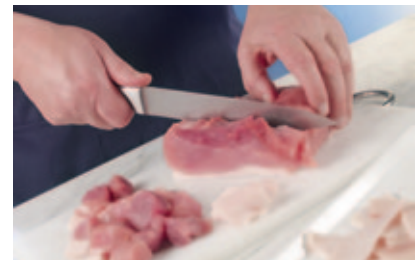
1. Das Fleisch mit einem scharfen Messer von Sehnen und Schwarten befreien, danach in Stücke schneiden.