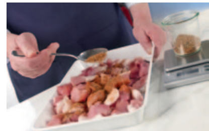
2. Fleischstücke in eine Schüssel oder Schale füllen und Gewürze sowie Kochsalz nach Rezept hinzugeben. Alles gründlich vermengen.