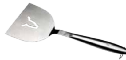
Abb. Wide Tongs