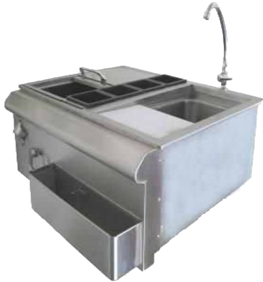
Abb. 30" Bar Centre