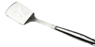
Abb. 17" Spatula