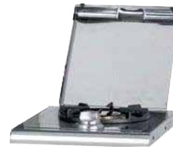
Abb. Signature Build In Side Burner