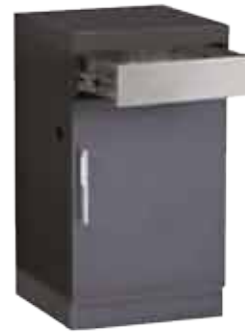
Abb. 1100 E ODK Cupboard Drawer Module