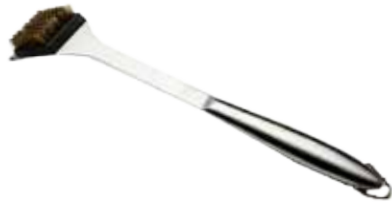
Abb. 17" Cleaning Brush