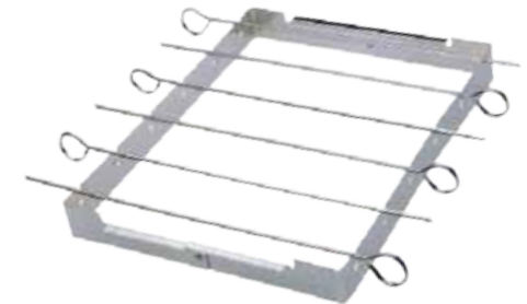
Abb. 7 Piece Kebab Rack & Skewer Set