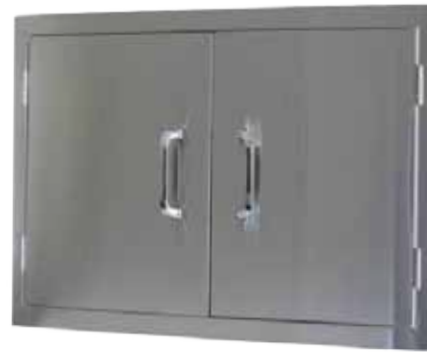
Abb. Double Door