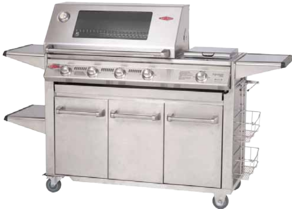
Abb. SL 4000 Series mit 5 Brennern