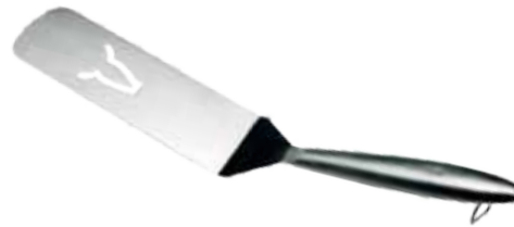
Abb. Long Spatula