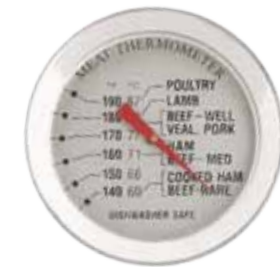
Abb. Meat Probe Thermometer