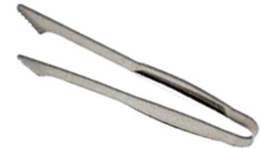
Abb. 17" Tongs