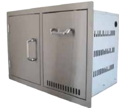
Abb. Single Door / Propane Tank Drawer