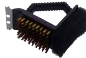
Abb. 3 in 1 Brush & Scraper