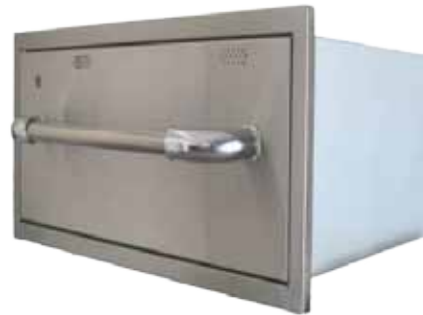
Abb. 30" Warming Drawer