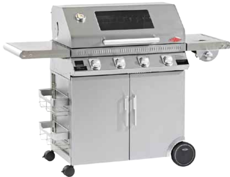
Abb. 1100 S Series mit 4 Brennern