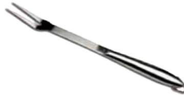
Abb. 17" Fork