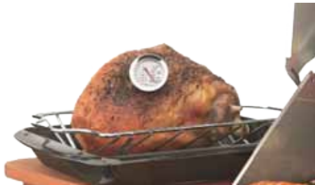
Abb. Roasting Tray