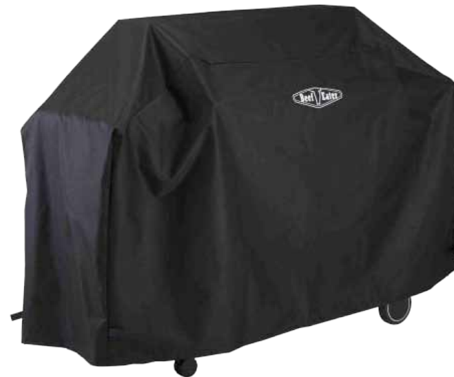
Abb. All Weather Cover