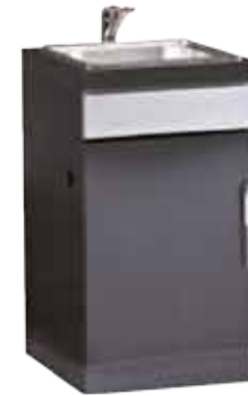
Abb. 1100 E ODK Sink Module