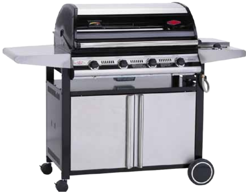
Abb. 1000 Series Plus mit 4 Brennern