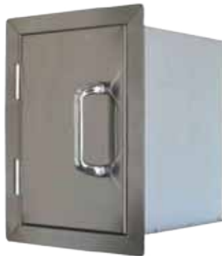
Abb. Paper Towel Holder