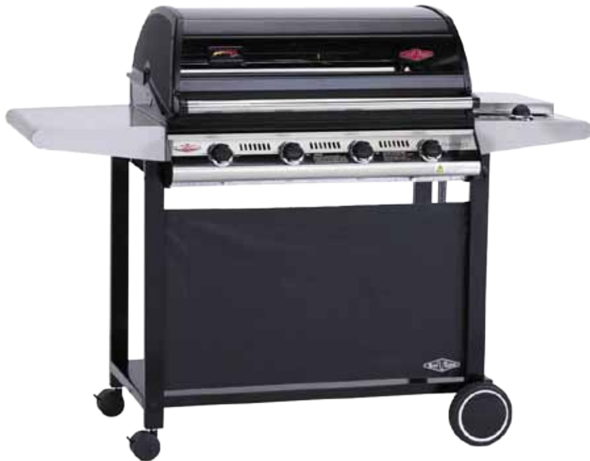
Abb. 1000 Series Deluxe mit 4 Brennern