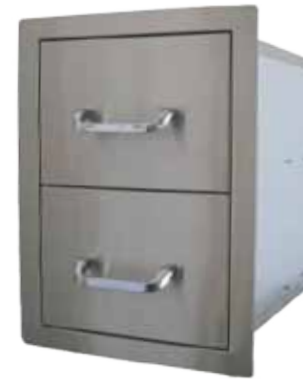
Abb. Double Drawer