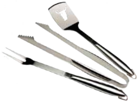
Abb. 3 Piece Tool Set