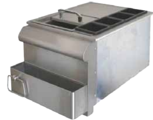
Abb. 18" Bar Centre