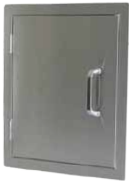
Abb. Single Door