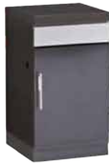
Abb. 1100 E ODK Cupboard Module