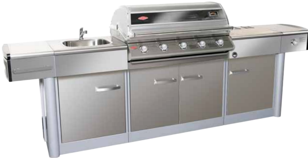
Abb. Discovery Premium Outdoor Kitchen mit 5 Brennern