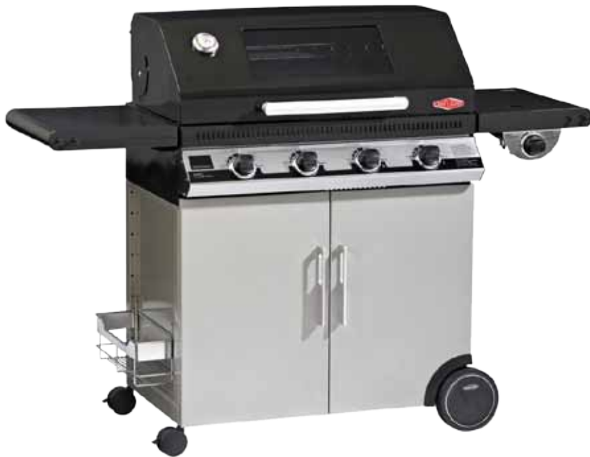
Abb. 1100 E Series mit 4 Brennern