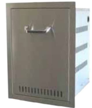
Abb. Propane Tank Drawer