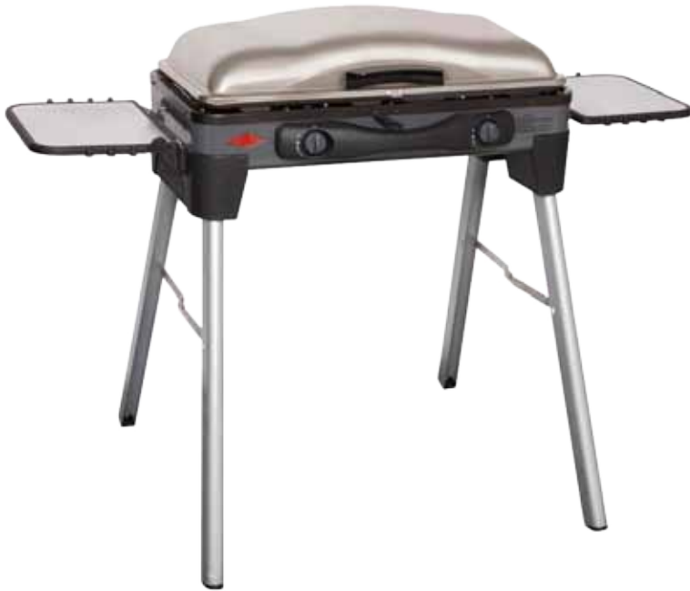
Abb. Sportz Grill mit 2 Brennern