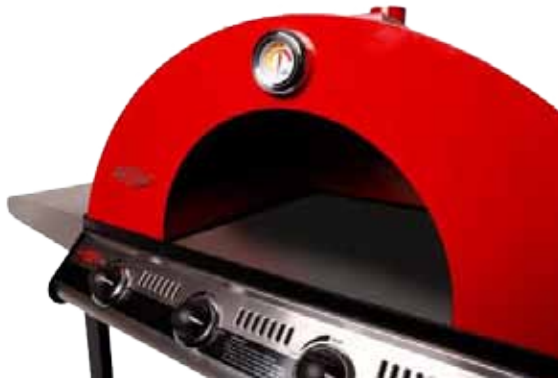
Abb. Pizza Oven