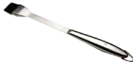
Abb. 17" Basting Brush