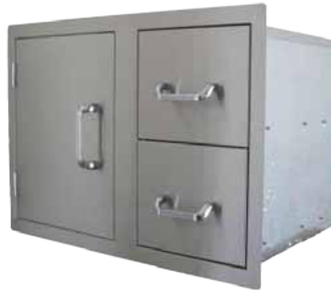
Abb. Single Storage Door / Double Drawer