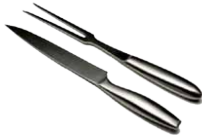
Abb. 2 Piece Carving Set