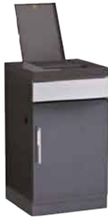
Abb. 1100 E ODK Side Burner Module